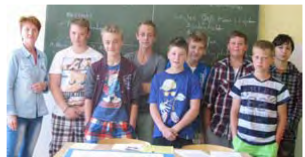
Der Wald im Wandel der Zeit