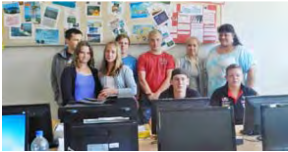
Der Ritter und das Burgfräulein