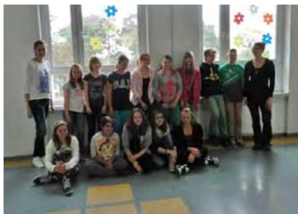
Spieglein, Spieglein an der Wand ... Teil A