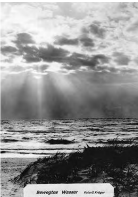
„Bewegtes Wasser“ Gerlinde Krüger, Teupitz