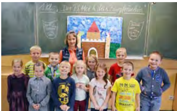
Ritter und Burgen