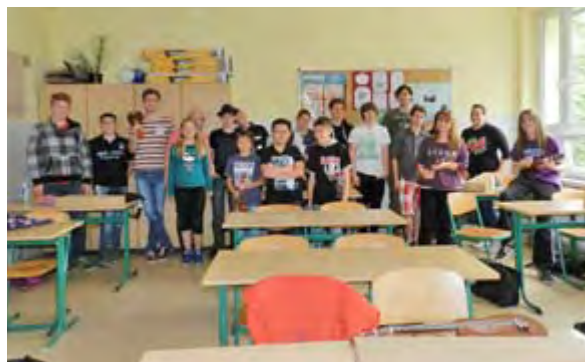
Vom Grammophon zur MP 3 – Let's dance