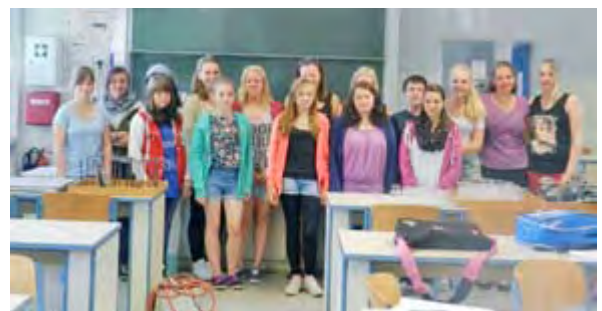
Kosmetik gestern und heute