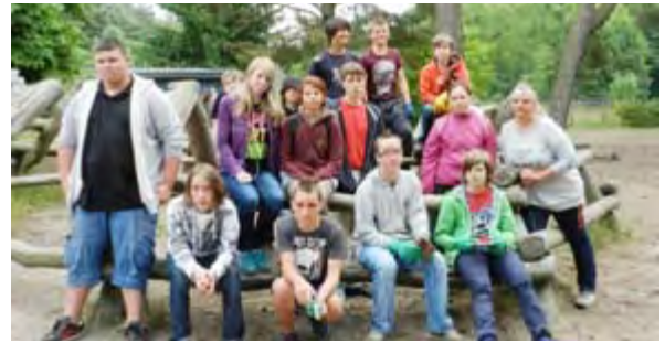
Schule wird bunt