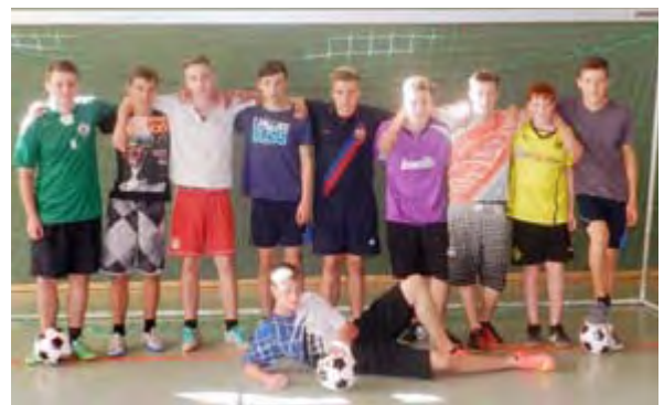
Die Geschichte der Fußball-WM