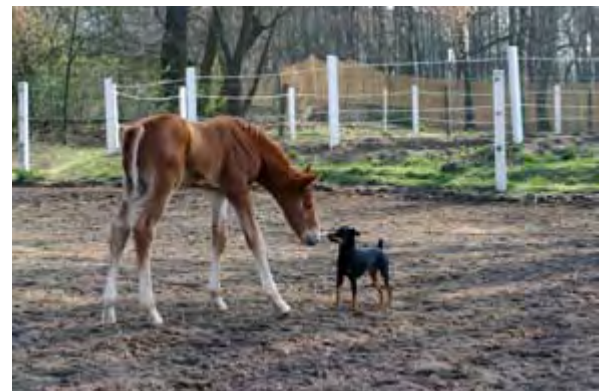
„Der erste Kuß“ Gisela Fahr, Teupitz

Die Fotografien werden auf dem Bürgerfest in Halbe am Sonnabend, den 15. November 2014 im Künstlerzelt ausgestellt.