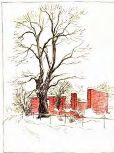
Ruine der bei Kriegsende niederbrennenden alten Schule, nach einer Originalskizze von 1950/55

Im April 1945 wurden in unserem Ort drei Panzersperren errichtet. Die erste Sperre entstand am Gasthaus „Deutsches Haus“ in der Lindenstraße. Sie sollte von Motzen und Pätz sowie aus der Sputendorfer Straße kommende Panzer und Fahrzeuge aufhalten. Die 2. Sperre befand