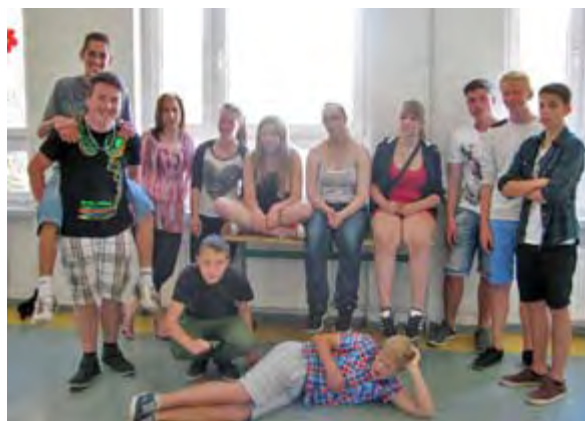
Spieglein, Spieglein an der Wand ... Teil B