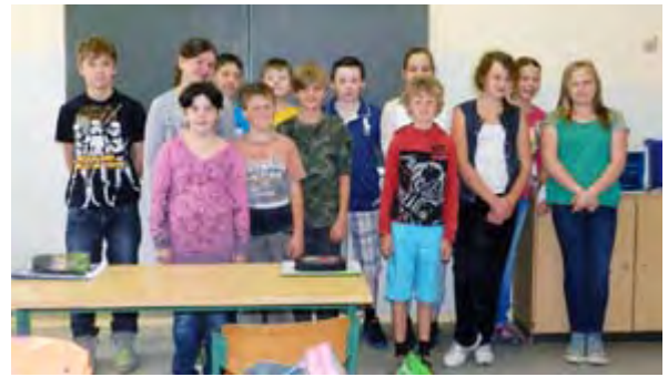
Von der Höhlenmalerei zum E-Book