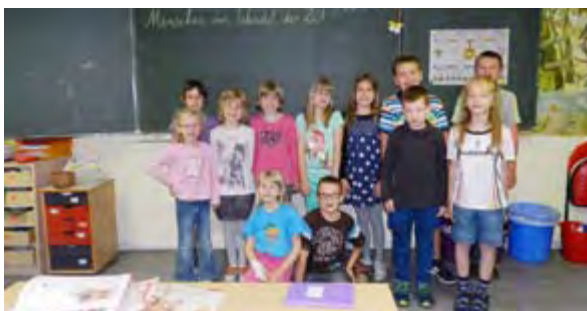
Afrika – Kontinent der Faszination und Widersprüche