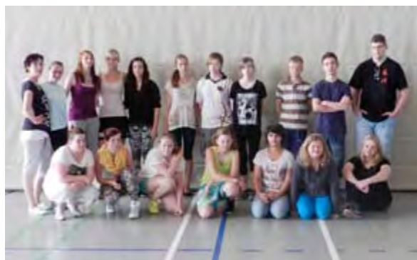
Mode im Wandel der Zeit